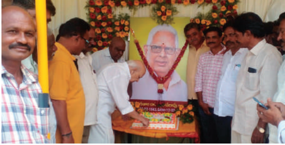
మంచి నాయకుడిని కోల్పోవడం బాధాకరం