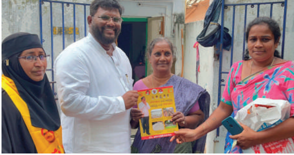
▶ అభివృద్ధి పాలన ఎవరిదో, విధ్వంస పాలన ఎవరిదో ప్రజలకు తెలుసు.

▶ రాష్ట్ర అభివృద్ధిపై చర్చించేందుకు వైసిపి నాయకులకు దమ్ముందా?