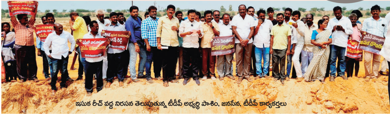
ఇసుక రీచ్ వద్ద నిరసన తెలుపుతున్న టీడీపీ అభ్యర్థి పాశిం, జనసేన, టీడీపీ కార్యకర్తలు