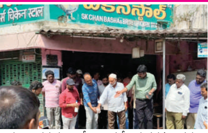
నుంచి తదుపరి ఆదేశాలు వచ్చేంత వరకు ఎవరూ చికెన్ విక్రయాలు, కొనుగోలు జరపరాదని డాక్టర్ హెచ్చరించారు. హెబ్బాట్ల, రెస్టారెంట్ లు, బార్లు,