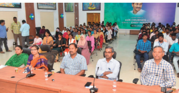
నెల్లూరు బ్యూరో ( ప్రశ్న న్యూస్) : మన విశ్వవిద్యాలయాల విద్యార్థులు