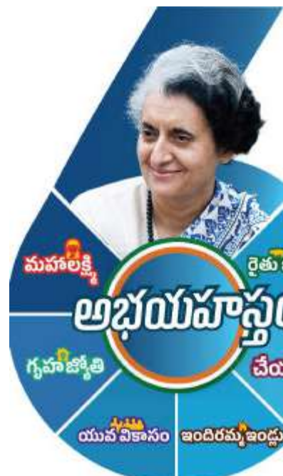
పైచరాబాద్ (ప్రశ్న న్యూస్) తెలంగాణ ప్రభుత్వం ఎన్నికల హామీల దిశగా కార్యాచరణ ప్రారంభించింది. ఇప్పటికే ప్రజా పాలన ద్వారా పథకాల అమలుకు ధరభాస్వలు స్వీకరించింది. ఈ నెలాఖరులోగా ఏ పథకానికి ఎంత మంది

కలకత్తా (ప్రశ్న న్యూస్) పశ్చిమ బెంగాల్ ముఖ్యమంత్రి మమతా బెనర్జీ రోడ్డు ప్రమాదంలో గాయపడ్డారు. తృణమూల్ కాంగ్రెస్ పార్టీ అధినేత్రి, పశ్చిమ బెంగాల్ ముఖ్యమంత్రి మమతా బెనర్జీ ప్రయాణిస్తున్న కారు ప్రమాదానికి గురైనట్లుగా అధికారులు వెల్లడించారు. బర్మాన్ నుంచి కోల్ కత్తా తిరిగి వస్తుండగా మమతా బెనర్జీ కారు ప్రమాదానికి గురైంది. ఈ ప్రమాదంలో ఆమె తలకు స్వల్ప గాయం అయినట్లు