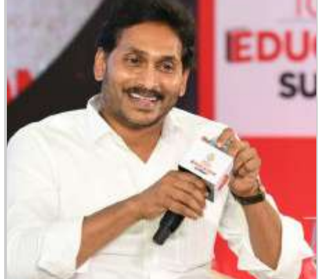
పదవి నుంచి దిగిపోయాను తనకేం బాధ ఉందన్నాడు ముఖ్యమంత్రి జగన్మోహన్ రెడ్డి. రాజకీయ లబ్ధికోసమే కాంగ్రెస్ పార్టీ రాష్ట్రాన్ని విడదీసిందన్న ఆయన విభజించి పాలించడమే ఆ పార్టీ విధానమని విమర్శించారు. గతం నుంచి హస్తం పార్టీ పాతాలు నేర్చుకోలేదన్న సీఎం జగన్

ఏపీలో పీసీసీ ఫీఫ్ గా సోదరి వైఎస్ షర్లల నియామకం ద్వారా కాంగ్రెస్ పార్టీ చేస్తున్న రాజకీయాలపై సీఎం వైఎస్ జగన్ తీవ్రంగా మండిపడ్డారు. తిరుపతిలో ఓ జాతీయ మీడియా ఛానల్ నిర్వహిస్తున్న ఎమ్మెల్యే కెన్ కేమ్ లో పాల్గొన్న జగన్ కాంగ్రెస్ రాజకీయాలు, చంద్రబాబు అరెస్టు, కేంద్రంలో సంబంధాలు వంటి కీలక అంశాలపై తన అభిప్రాయాల్ని ఎడిటర్ రాజ్ దీప్ సర్కేయా తో పంచుకున్నారు.