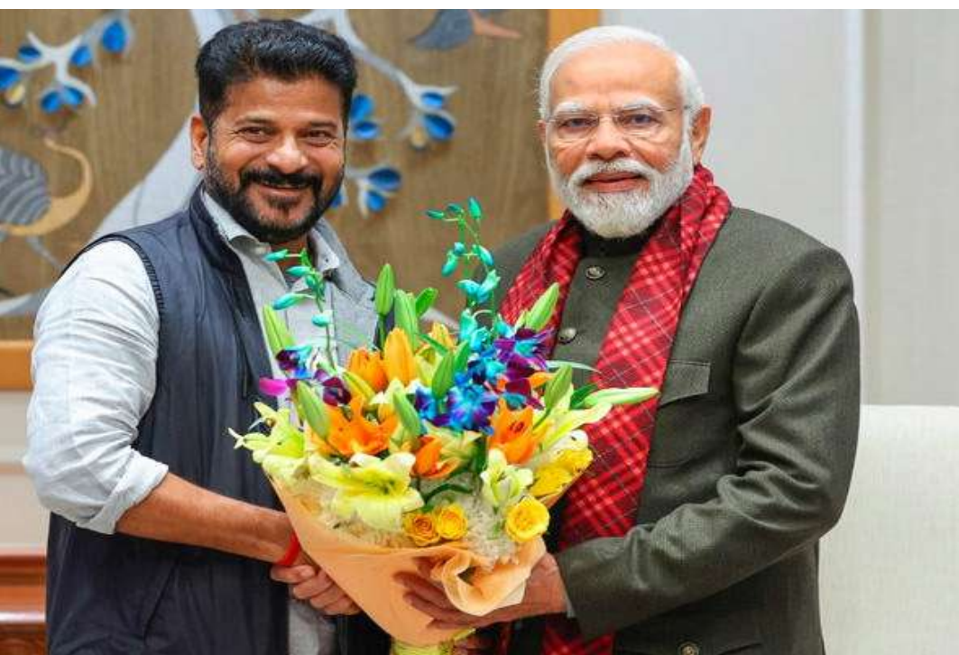
కలివితే ప్రస్తుత ఆర్థిక సంవత్సరంలో తెలంగాణ ప్రభుత్వం మొత్తంగా రూ 39,551 కోట్లు అప్పుగా తీసుకున్నట్లు స్పష్టం అవుతోంది.

ప్రస్తుత ఆర్థిక సంవత్సరం (2023-24) లో రూ 38,234 కోట్ల మేర రుణాలు తీసుకోవచ్చున్నట్లు బడ్జెట్ లో గత ప్రభుత్వం ప్రకటించింది. ప్రతిపాదించిన రుణాలను ఆర్థిక సంవత్సరం ముగిసేలోగా సేకరించటం సాధారణం జరిగే ప్రక్రియ. అయితే, అసెంబ్లీ ఎన్నికల వేళ ముందుగానే బీఆర్ఎస్ ప్రభుత్వం పూర్తిగా రుణ సదుపాయం వినియోగించుకుంది. ఎనిమిది నెలల కాలంలోనే గత ప్రభుత్వం రూ 38,151 కోట్ల రుణాలను తీసుకుంది కాగ్ వెల్లడించింది. దీంతో, రేవంత్ ప్రభుత్వం కొలువు తీరిన వెంటనే రూ 1,400 రుణం సేకరించింది. వీటితో