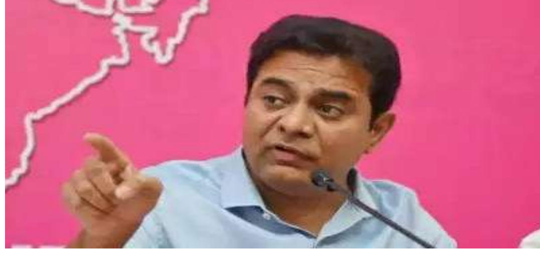
వింటున్నారని కేటీఆర్ పేర్కొన్నారు. ఈ ప్రజాపాలన దరఖాస్తు పత్రాలలో కోట్లాది తెలంగాణ ప్రజల సున్నితమైన డేటా ఉందని గుర్తు చేశారు. ఈ రహస్య డేటా సైబర్ నేరగాళ్ల చేతిలోకి వెళ్లకుండా రాష్ట్ర ప్రభుత్వం తగిన చర్యలు తీసుకోవాలని కోరుతున్నారని కేటీఆర్ పేర్కొన్నారు. 'ప్రియమైన తెలంగాణ సోదర, సోదరీమణులారా ఎవరైనా మీకు పెన్షన్ లేదా ఇల్లు లేదా ఆరు గ్యారంటీలతో ఏదైనా ఇస్తామని కాలే చేస్తే ఓటీటీని లేదా బ్యాంకు వివరాలను షేర్ చేయవద్దని కేటీఆర్ హెచ్చరించారు. డి.పూర్ణి సీఎం మల్లు భట్టి మాటలు విని అనవసరంగా డబ్బులు పోగొట్టుకోవద్దన్నారు. మీరు బీఆర్ఎస్ పార్టీకి ఓటు వేశారా? లేదా ఇతర పార్టీకి వేశారా? అనే దాంతో సంబంధం లేదు. కానీ, సైబర్ క్రైమ్ చట్టాన్ని రూపొందించడంలో భాగమైన వ్యక్తిగా నా మాటలను తీవ్రంగా పరిగణించాలని.. సైబర్ నేరగాళ్ల బారిన పడవద్దని హాజీ ఓటీటీ మంత్రి కేటీఆర్ సూచించారు.

హైదరాబాద్ (ప్రశ్న న్యూస్) కాంగ్రెస్ ప్రభుత్వం ప్రతిష్టాత్మకంగా చేపట్టిన ప్రజా పాలన అభయహస్తం దరఖాస్తులు రోడ్డుపై పడిపోయే విషయాలపై విమర్శలు వెల్లువెత్తుతున్నాయి. ప్రజా పాలన దరఖాస్తు చేసుకున్న లబ్ధిదారులకు సంబంధించిన డేటా విషయంలో ఆందోళన వ్యక్తమవుతోంది. సైబర్ నేరగాళ్ల పట్ల జాగ్రత్తగా ఉండాలని ప్రజలకు సూచిస్తున్నారు. ఈ క్రమంలో బీఆర్ఎస్ వర్కింగ్ ప్రెసిడెంట్ కేటీఆర్ కాంగ్రెస్ ప్రభుత్వంపై విమర్శలు గుప్పించారు. ప్రజా పాలన దరఖాస్తులపై డేటా బహిష్కరణ కాపడడంతో సైబర్ నేరగాళ్ల బారిన పడకుండా ప్రజలు అప్రమత్తంగా ఉండాలని హాజీ మంత్రి సూచించారు. ప్రైవేటు ఏజెన్సీల నిర్లక్ష్యం కారణంగా ప్రజాపాలన దరఖాస్తులు బహిష్కరణపట్ల వస్తున్న వార్తలను చూశానని కేటీఆర్ అన్నారు. ఆ అప్లికేషన్లో కోట్లాదిమంది తెలంగాణ ప్రజల సెన్సిటివ్ డేటా ఉందని పేర్కొన్నారు. ఈ సమాచారం సైబర్ నేరగాళ్ల బారిన పడకుండా రాష్ట్ర ప్రభుత్వం జాగ్రత్తలు తీసుకోవాలని విజ్ఞప్తి చేశారు. అలాగే ఎవరైనా కాలే చేసి ఆరు గ్యారంటీలు మంజూరయ్యాయని ఓటీటీ అడిగితే చెప్పవద్దని తెలంగాణ సోదరసోదరీమణులను సూచించారు. డి.పూర్ణి సీఎం భట్టి విక్రమార్కు మాటలు విని అనవసరంగా డబ్బులు పోగొట్టుకోవద్దని సూచించారు. బీఆర్ఎస్ కు ఓటు వేసిన ఓటు వేయకపోయినా సరే తన మాటలను సీరియస్ గా తీసుకుని సైబర్ నేరగాళ్ల బారిన పడవద్దని కోరారు. కొంతమంది ప్రయత్నాలు ప్రజాపాలన దరఖాస్తుల పట్ల చాలా నిర్లక్ష్యంగా ఉన్నారని ఇందుకు సంబంధించి వీడియోలను చూస్తున్నారని అలాగే పలువురి సుంచి