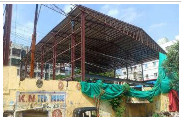
విస్తూయానికి గురిచేస్తుంది. అయితే ఉప్పులే నియోజకవర్గంలో