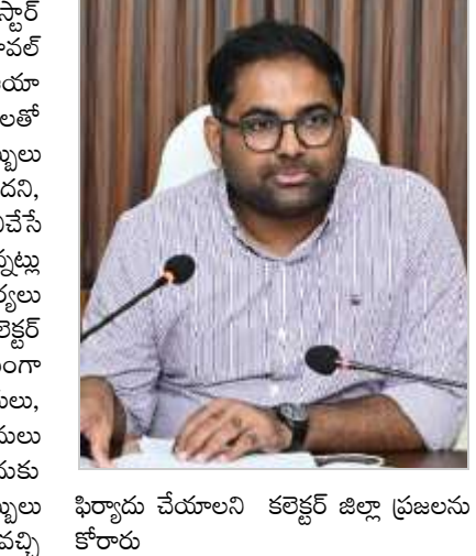
ఫిర్యాదు చేయాలని కలెక్టర్ జిల్లా ప్రజలను కోరారు

కార్యాలయం, తహసీల్దార్, రిజిస్ట్రార్ కార్యాలయాల్లో పాటు లెఅవుట్ అప్రూవల్ కోసు వెళ్ళిన వారి నుంచి ఆయా కార్యాలయాల్లో అధికారులు, ఉద్యోగులతో పాటు జిల్లా అధికారులు సైతం డబ్బులు డిమాండ్ చేస్తున్నట్లు తన దృష్టికి వచ్చిందని, ఒకవేళ ఆయా కార్యాలయాల్లో పనిచేసే వారు ప్రజల నుంచి డబ్బులు తీసుకున్నట్లు తెలిస్తే వారిపై కఠిన చర్యలు తీసుకుంటామని ఈ సందర్భంగా కలెక్టర్ కలెక్టర్ తెలిపారు. ప్రజలు నిర్భయంగా ప్రభుత్వ కార్యాలయాలకు వెళ్లి అధికారులు, ఉద్యోగులతో తమ పనులు చేసుకోవాలన్నారు. పనులు చేసేందుకు ఎవరైనా డబ్బులు అడిగితే పనిచేసే నేరుగా కలెక్టర్ కు వచ్చి