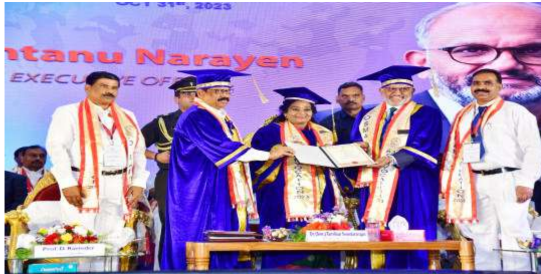
కోలోవద్దని... ప్రతి సందర్భంలోనూ దైర్ఘ్యంతో, సంకోచంతో ముందుకు సాగాలని చెప్పారు. ప్రతి విభాగంలోనూ బంగారు పతకాలు అందించేందుకు దాతలు, పారిశ్రామికవేత్తలు, పూర్వ విద్యార్థులు ముందుకు రావాలని ఆమె పిలుపునిచ్చారు. ప్రతి ఒక్కరూ స్వతహాగా ప్రేరణ పొందుతూ, ఎడగాలని అన్నారు. అనంతరం ముఖ్య అతిథిగా హాజరైన శంకర్ నారాయణ్ మూలాలు... ఇక్కడ చదువుకు ప్రపంచ అగ్రగణ్య సంస్థకు నాయకత్వం వహించటం ఎందరినీ గౌరవించారు. ప్రతి ఒక్కరికీ ఉన్నత స్థాయికి ఎదిగే సామర్థ్యం ఉంటుందని, ప్రతి ఒక్కరూ కష్టపడి ఉన్నత స్థాయికి చేరుకోవాలని సూచించారు