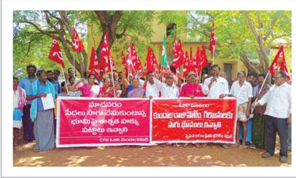
తహసీల్దార్ కార్యాలయం ఎదుట ధర్మా నిర్వహిస్తున్న సిపిఎం పార్టీ నాయకులు, కుందాం, మాచవరం ప్రజలు

ఓజిలి ప్రతినిధి ( ప్రశ్న న్యూస్) : ఎర్రదళం( సిపిఎం పార్టీ) రోజులు తాసిల్దార్ కార్యాలయం ఎదుట ధర్మా చేపట్టారు. మండలం కేంద్రంలో ఎమ్మార్వీ కార్యాలయం వద్ద గురువారం మండలంలోని మాచవరం, కుందాం, పేదలు సిపిఎం పార్టీ ఆధ్వర్యంలో సాగు భూములకు పట్టాలు ఇవ్వాలని ధర్మా నిర్వహించారు ఈ సందర్భంగా సిపిఎం జిల్లా కార్యదర్శి వందవాసి నాగరాజు మాట్లాడుతూ మాచవరం సర్వే నెంబరు 207,226 లో భూములు సాగు చేస్తుంటే రెవెన్యూ యంత్రాంగం, పోలీసు యంత్రాంగం నిమ్మ చెట్లు తొలగించడం అన్యాయమని పేర్కొన్నారు పేదలకు రెండు ఎకరాలు భూములు అడిగితే ఇవ్వకుండా కాలయాపన చేస్తూ మరోవైపు భూస్వాములకు పెత్తందారులు మాత్రం వందలాది ఎకరాలు ఆక్రమించుకుంటే రెవెన్యూ అధికారులు నిద్రపోతున్నారా అని ప్రశ్నించారు కుందం రెవెన్యూ సర్వే నెంబరు 1లో 1200 ఎకరాలు మేత పోరంట్లో భూములు ఉన్నని వాటిని సర్వే చేసి గిరిజనులకు పంపిణీ చేయాలని డిమాండ్ చేశారు రాష్ట్ర ముఖ్యమంత్రి వైఎస్ జగన్మోహన్ రెడ్డి పేదలకు అందరికీ భూములు ఇవ్వాలని పదేపదే మీడియాలో దానికి మాత్రమే పరిమితమయ్యారని వాస్తవానికి ప్రజాక్షేత్రంలో అర్జులైన పేదలకు భూములు ఇవ్వడంలో అధికారులు కాలయాపన చేస్తున్నారని ఎద్దేవా చేశారు. నియోజవర్గ ఎమ్మెల్యే కిలివేటి సంజీవయ్య సాగు భూములకు పట్టాలు పంపిణీ చేయడం లో విఫలమయ్యారని ప్రధమ పౌరుడుగా మండల లో మాచవరం కుందాం పేదలకు సాగుభూములు కి పట్టాలు ఇప్పించి పేదలకు అండగా ఉండాలని ఆయన డిమాండ్ చేశారు పేదలకు సాగుభూములు పట్టాలు ఇవ్వడంలో నిర్లక్ష్యం హామీ సిపిఎం పార్టీ ఆధ్వర్యంలో ఓజిలి