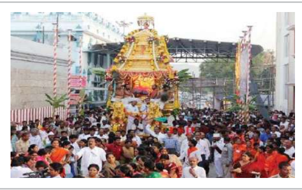
▶ నవంబర్ 18న పంచమి తీర్థానికి అమ్మవారి పుష్కలిణి ముస్తాబు ▶ టీటీడీ ఈవో ఏ.వి.ధర్మారెడ్డి

తిరుమల ప్రతినీధి (ప్రశ్న న్యూస్) : తిరుచానూరు శ్రీ వడ్డావతి అమ్మవారి బ్రహ్మాత్మవాలను వైభవంగా నిర్వహించేందుకు విస్తృతంగా ఏర్పాట్లు చేపట్టాలని టీటీడీ ఈవో ఏ.వి.ధర్మారెడ్డి అధికారులను ఆదేశించారు. తిరుపతిలోని టీటీడీ పరిపాలన భవనంలో గల సమావేశ మందిరంలో గురువారం ఉదయం జిల్లా కలెక్టర్, ఎస్పీ, మున్సిపల్ కార్పొరేషన్ కమిషనర్ ఇతర టీటీడీ అధికారులతో సమావేశం నిర్వహించారు. ఈ సందర్భంగా ఈవో మాట్లాడుతూ జిల్లా యంత్రాంగం, తిరుపతి మున్సిపల్ కార్పొరేషన్, పోలీసు అధికారులతో సమన్వయం చేసుకుని అమ్మవారి బ్రహ్మాత్మవాలకు విచ్చేసే భక్తులకు ఎలాంటి అసౌకర్యం కలగకుండా ఏర్పాట్లు చేపట్టాలని అధికారులను ఆదేశించారు. నవంబర్ 14న గజ వాహనం, 18న పంచమి తీర్థానికి విశేషంగా భక్తులు వచ్చే అవకాశం ఉందని, పోలీసుల అధికారులతో సమన్వయం చేసుకొని ట్రాఫిక్ క్రమబద్ధీకరణ, బారీకేడ్లు ఏర్పాటు చేయాలన్నారు. పంచమి తీర్థం నాడు శ్రీవారి పడి ఊరేగింపు అతిపెద్ద పాదాలమండపం నుంచి మొదలవుతుందని, కోమలమ్మ సత్రం, పసుపు మండపం మీదుగా అమ్మవారి ఆలయానికి చేరుకుంటుందని తెలిపారు. దారి పొడవునా గజరాజులకు ఇబ్బందులు లేకుండా ట్రాఫిక్ ఏర్పాట్లు చేయాలని, తిరుపతి కార్పొరేషన్ అధికారులతో సమన్వయం చేసుకుని ఈ మార్గాన్ని పరిశుభ్రంగా ఉంచాలని సూచించారు. పుష్కలిణి స్నానం కోసం వచ్చే భక్తులు వేచి ఉండేందుకు నవజీవన్ కంటి