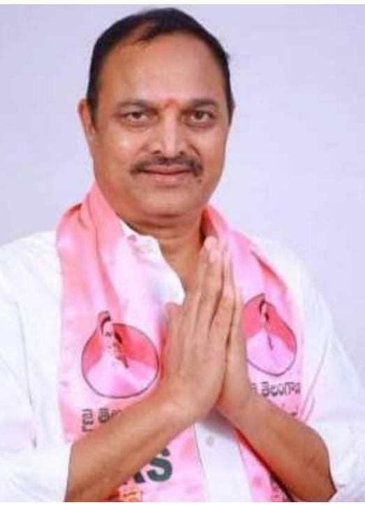
(ఆర్ కె- ప్రశ్న స్కూన్ బ్యూరో)

- ఆర్ ఎల్ ఆర్, బి ఎల్ ఆర్ మధ్య గట్టి పోటీ - ఆర్ ఎల్ ఆర్ తప్ప ఎవరికీ ఇచ్చినా ఓటమి తప్పదు