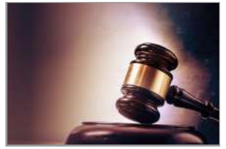
గుజరాత్ హైకోర్టుకు, అడిషనల్ జడ్జి దుప్పల వెంకటరమణను మధ్యప్రదేశ్ హైకోర్టుకు బదిలీ చేశారు. తెలంగాణ హైకోర్టు నుంచి మున్యూర్తి లక్ష్మణ్ ను రాజస్థాన్ హైకోర్టుకు, జి.అనుమమ్ చక్రవర్తిని పాఠ్య హైకోర్టుకు

న్యూఢిల్లీ (ప్రశ్న స్టూన్) దేశంలో న్యాయమూర్తుల నియామకాలు, బదిలీలు చేపట్టారు. 16 మంది న్యాయమూర్తులను బదిలీ చేయగా, 17 మంది న్యాయమూర్తుల నియామకం చేపట్టారు. ఈ మేరకు కేంద్ర న్యాయ వ్యవహారాల శాఖ మంత్రి అర్జున్ రామ్ మేఘాల్ వెల్లడించారు. ఈ ప్రక్రియలో ఏపీ హైకోర్టుకు కొత్తగా నలుగురు అదనపు జడ్జిలను నియమించారు. ఇప్పటివరకు న్యాయవాదులుగా ఉన్న న్యాయ విజయ్, హరినాథ్ నూనేపల్లి, సుమతి జగదం, కిరణ్బాయి మండవ ఇకమదల ఏపీ హైకోర్టులో అడిషనల్ జడ్జిలుగా వ్యవహరిస్తారు. ఇక, కర్ణాటక హైకోర్టు నుంచి న్యాయమూర్తి జి.నరేంద్రం ను అంధ్రప్రదేశ్ హైకోర్టుకు బదిలీ చేశారు. అదే సమయంలో, అంధ్రప్రదేశ్ హైకోర్టు నుంచి న్యాయమూర్తి మానవేంద్రనాథ్ రాయ్ ని