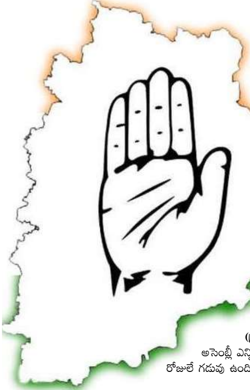
హైదరాబాద్ (ప్రశ్న స్టూన్) తెలంగాణ అసెంబ్లీ ఎన్నికలకు మరో నెల రోజులే గడువు ఉంది. ఈసారి అధికారం

బీఆర్ఎస్ ను ఎలాగైనా గద్దె దించాలని కాంగ్రెస్ సర్వశక్తులు ఒడ్డుతోంది. బీఆర్ఎస్ ఎత్తులకు పైఎత్తులు వేస్తోంది. ప్రచారంలోకి కూడా అగ్రనేతలను దించుతోంది. మరోవైపు ప్రజల్లో బీఆర్ఎస్ పాలనపై వ్యతిరేకత ఉందన్న అంచనాలు వేస్తోంది. సర్వేలు కూడా వచ్చే ఎన్నికల్లో ఏ పార్టీకి పూర్తి మెజారిటీ రాదని అంచనా వేస్తున్నాయి. పార్టీల సర్వేలు కూడా అదే చెబుతున్నాయి. ఈ నేపథ్యంలో కాంగ్రెస్ పట్టు బిగిస్తోంది. కర్ణాటక ఎన్నికలు ఇచ్చిన బాస్కం దూసుకుపోతోంది. ఈ క్రమంలో ఎన్నికల తర్వాత కాంగ్రెస్ ముఖ్యమంత్రి ప్రమాణం