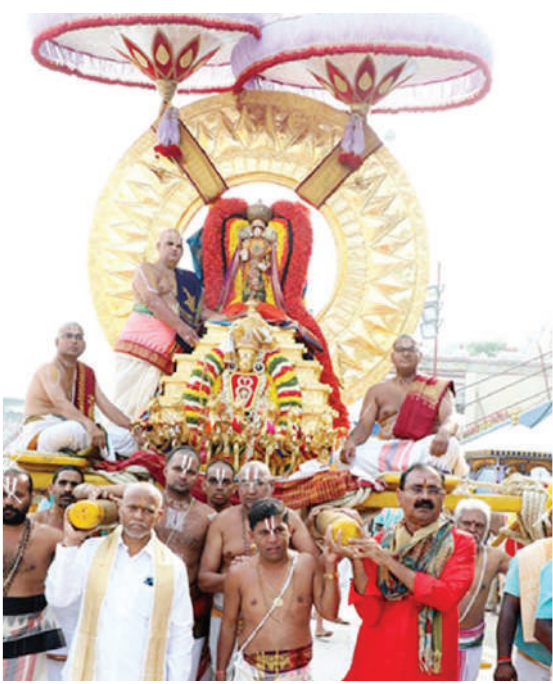
తిరుపతి ప్రతినిధి ( ప్రశ్న స్వాస్ ) : కలియుగదైవం ఏడుకొండస్వామి కొలువు తీరిన తిరుమలలో శ్రీ వేంకటేశ్వరస్వామివారి నవరాత్రి బ్రహ్మోత్సవాల్లో ఏడో రోజైన శనివారం ఉదయం శ్రీ మలయప్పస్వామివారు సూర్యప్రభ వాహనంపై భక్తులను కటాక్షించారు. వాహనం ముందు గజరాజులు