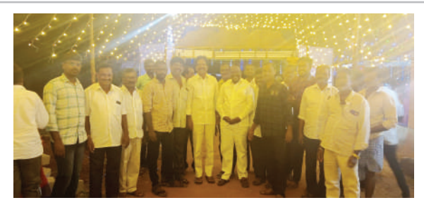
► ఓజిలి మండలం తెదేపా నాయకులు