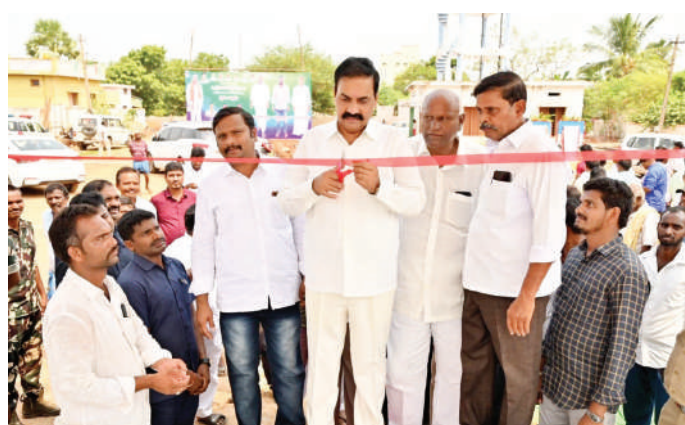
అభివృద్ధి కార్యక్రమాలను శంకుస్థాపన చేస్తున్న మంత్రి కాకాని గోవర్ధన్ రెడ్డి