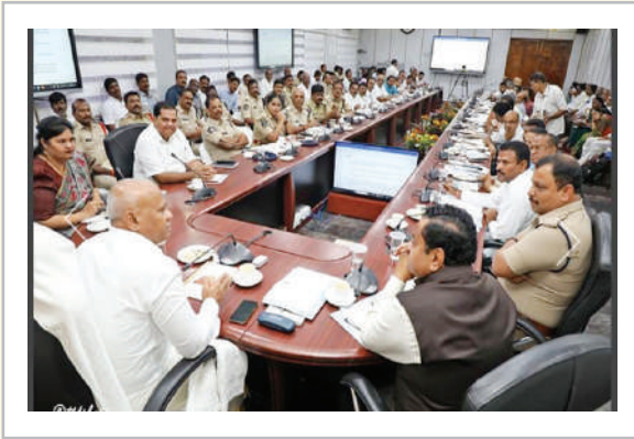
సమన్వయంతో శ్రీవారి భక్తులకు ఎలాంటి అసౌకర్యం కలగకుండా ఏర్పాట్లు చేపట్టినట్లు చెప్పారు. అక్టోబరు 19వ తేదీన గరుడసేవ, 20వ తేదీన పుష్పక విమానం, 22వ తేదీన స్వర్ణరథం, అక్టోబర్ 23వ తేదీన చక్రస్నానం