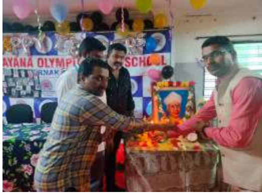
ఉపాధ్యాయులు, విద్యార్థిని, విద్యార్థులు పాల్గొన్నారు.