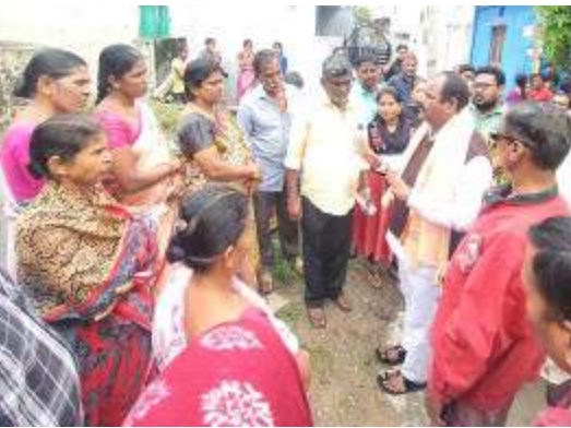
వీధి దీపాలు నిర్వహణను గాడిలో పెట్టాలని ఆ విభాగాల అధికారులను ఆదేశించారు. ప్రజా సమస్యల పరిష్కారం కోసం బస్టిలు, కాలనీల్లో విస్తృతంగా పాదయాత్రలు చేపడుతున్నట్లు కార్పొరేటర్ తెలిపారు. నెహ్రూనగర్ కాలనీలో గత మూడు రోజులుగా కురుస్తున్న వర్షాల నేపథ్యంలో నెహ్రూనగర్ లోతట్టు ప్రాంతాలను కార్పొరేటర్ సంబంధిత జిహాద్ ఎంసి అధికారులతో కలిసి పరిశీలించారు. లోతట్టు ప్రాంతాల ప్రజలకు ఎలాంటి ఇబ్బందులు కలుగకుండా అప్రమత్తంగా ఉండి, ముందున్న చర్యలు చేపట్టాలని అధికారులను ఆదేశించారు. ఈ

శేరిలింగంపల్లి (ప్రశ్న స్కూస్) శేరిలింగంపల్లి డివిజన్ లోగల గోపినగర్ గణేష్ కట్ట పరిసర ప్రాంతాల్లో మౌలిక సదుపాయాల కల్పనకు ప్రత్యేక చర్యలు తీసుకుంటున్నట్లు కార్పొరేటర్ రాగం నాగేందర్ యాదవ్ తెలిపారు. మంగళవారం పలు ప్రాంతాలు పర్యటించి ప్రజల నుంచి వస్తున్న ఫిర్యాదులను నేరుగా జస్టివాసులను కలుసుకొని స్థానికంగా నెలకొన్న సమస్యలను అడిగి తెలుసుకున్నారు. ఈ సందర్భంగా పలువురు స్థానికులు తమ బస్టిలో డ్రైనేజీ, తాగునీటి సైపులైన్ నిర్మాణాలు చేపట్టాలని స్థానికులు కోరారు. ఈ సందర్భంగా కార్పొరేటర్ మాట్లాడుతూ శేరిలింగంపల్లి డివిజన్ పరిధిలోని అన్ని ప్రాంతాల్లో దాదాపుగా సిసి రోడ్లు పూర్తయ్యాయి మిగిలిన కొన్ని చోట్ల సూతన సీసీ రోడ్ల పనులు ప్రారంభించి త్వరితగతిన పూర్తి అయ్యేలా కృషి చేస్తానని హామీ ఇచ్చారు. స్థానికుల విజ్ఞప్తి మేరకు డ్రైనేజీ, తాగునీటి సైపులైన్ నిర్మాణ సాధ్య సాధ్యాలను పరిశీలించి వెంటనే కొత్త సైపులైన్ నిర్మాణం చేయాలని అధికారులను కోరారు. బస్టిల్లో పారిశుధ్యం,