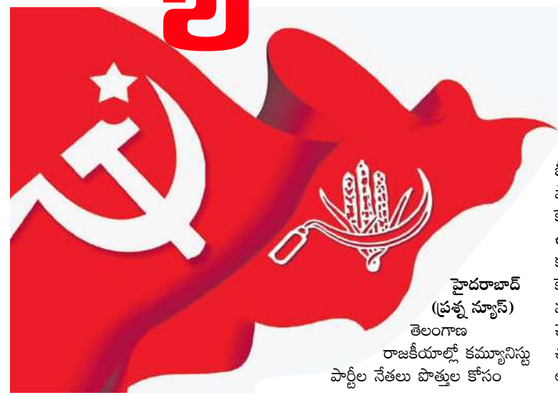
హైదరాబాద్ (ప్రశ్న స్వాస్) తెలంగాణ రాజకీయాల్లో కమ్యూనిస్టు పార్టీల నేతలు పొత్తుల కోసం