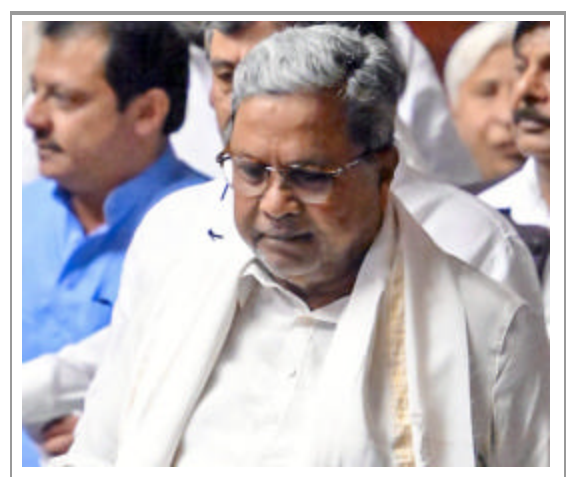
విశ్వేశ్వరయ్య లేఅవుట్లో మెటర్నిటీ హాస్పిటల్, కెంగేరీ శాటిలైట్ టౌన్ లో ప్లెటవర్ పనులు గురించి ముఖ్యమంత్రితో చర్చించినట్లు