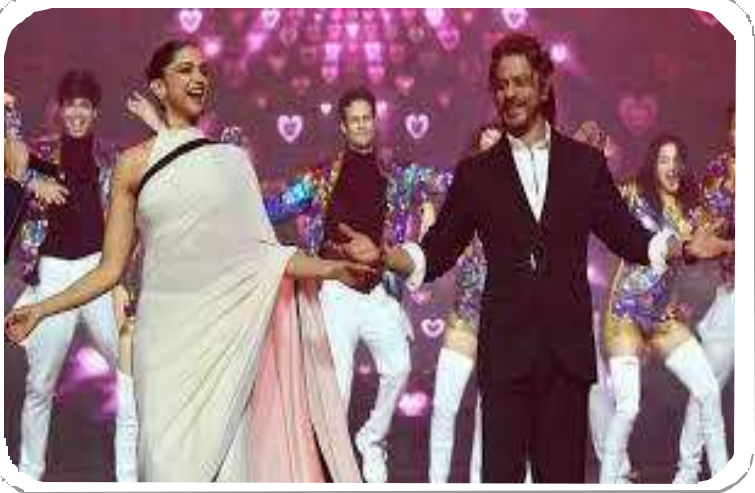
షారుఖ్ డ్యాన్స్ చేయటంతో ఆడియన్స్ ట్రిల్ అయ్యారు. ఇక ప్రస్తుతం దీనికి సంబంధించిన వీడియో షేర్ అవుతుంది.

అట్టి దర్శకత్వంలో బాలీవుడ్ బాద్షా షారుఖ్ ఖాన్ నటించిన తాజా యాక్షన్ ఎంటర్టైన్మెంట్ 'జవాన్' ఈ చిత్రం విడుదలైన వారం రోజుల్లోనే వరల్డ్ వైడ్ గా రూ. 695 కోట్లు కొల్లగొట్టింది. ఈ వారం నార్త్ లో చెప్పుకోదగ్గ రెంజంలో సినిమాల్లో రిలీజ్ కాకపోవడం బాగా కలిసొచ్చింది. ఇదే జోరు కొనసాగితే వచ్చే వారంలోపు వెయ్యి కోట్ల మార్కు అందుకునే చాన్స్ ఉంది. అదే జరిగితే తొలిసారి రెండు వెయ్యి కోట్ల సినిమాలు ఉన్న తొలి ఇండియన్ హీరోగా షారుఖ్ చరిత్ర సృష్టించిన వాడవుతాడు. ఇదిలా ఉండగా ముంబయిలో 'జవాన్' సక్సెస్ వేడుకలు గ్రాండ్ గా జరిగాయి. ఈ ఈవెంట్లో సెన్సేషనల్ మ్యూజిక్ డైరెక్టర్ అనిరుధ్ రవిచందర్ తన లైవ్ పర్ఫార్మెన్స్ తో మరోసారి అదరగొట్టారు. 'జవాన్' సక్సెస్ ఈవెంట్లో భాగంగా 'చలేయా' పాట పాడిన అనిరుధ్ షారుఖ్ ఖాన్, డీపికలను చేయి పట్టుకొని స్టేజీపైకి తీసుకెళ్లారు. అనంతరం 'చలేయా' పాటకు అనిరుధ్తో కలిసి షారుఖ్ ఖాన్, డీపిక స్టేజీలు వేశారు. దీంతో 'ప్రేక్షకుల కేకలు, విజ్ఞానో ఈవెంట్ దర్శకత్వంలో ఉంది. షారుఖ్ డ్యాన్స్ చేయటంతో ఆడియన్స్ ట్రిల్ అయ్యారు. ఇక ప్రస్తుతం దీనికి సంబంధించిన వీడియో షేర్ అవుతుంది.