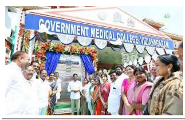
దిశగా అడుగులు వేస్తున్నామన్నారు. ప్రతీ పాఠ్యపుస్తకం నియోజకవర్గ పరిధిలో ఓ మెడికల్ కాలేజీ ఉండబోతోందని ఇవాళ ఐదు మెడికల్ కాలేజీలు ప్రారంభించుకున్నామని వచ్చే ఏడాది మరో ఐదు మెడికల్ కాలేజీలు ప్రారంభిస్తామన్నారు. ఆ మరుసటి ఏడాది మరో ఐదు కాలేజీలు

అమరావతి (ప్రశ్న స్వూస్) ఆంధ్రప్రదేశ్ లో ఒకేసారి ఐదు మెడికల్ కళాశాలల ప్రారంభానికి శ్రీకారం చుట్టారు ముఖ్యమంత్రి వైఎస్ జగన్. విజయనగరం జిల్లా కేంద్రంలో నిర్మించిన వైద్య కళాశాలను శుక్రవారం నేరుగా ప్రారంభించారు. అనంతరం మచిలీపట్నం, రాజమండ్రి, ఏలూరు, నంద్యాల ప్రభుత్వ వైద్య కళాశాలలను పర్యవేక్షణ కళాశాల విద్యార్థులతో వీడియో కాన్ఫరెన్స్ లో మాట్లాడారు. వైద్య కళాశాలలో సిగ్నల్ ల్యాబ్, బయోటెక్నాలజీ ల్యాబ్, అనాటమీ మ్యూజియంలను పరిశీలించారు. దేవుడి దయతో రాష్ట్రంలో ఓ మంచి కార్యక్రమం చేస్తున్నామన్నారు సీఎం జగన్. ఐదు మెడికల్ కాలేజీలు ప్రారంభించడం సంతోషంగా ఉందన్నారు. రానున్న రోజుల్లో విద్యార్థులంతా గొప్ప డాక్టర్లు కావాలని జీవితంలో అత్యుత్తమ స్థాయికి చేరుకోవాలని ఆశంకొందన్నారు. స్వాతంత్ర్యం వచ్చాక ఏపీలో కేవలం 11 మెడికల్ కాలేజీలే ఉన్నాయని అందుకే ఈ 11 మెడికల్ కాలేజీలకు మరో 17 మెడికల్ కాలేజీలను చేర్చి 28 మెడికల్ కాలేజీల