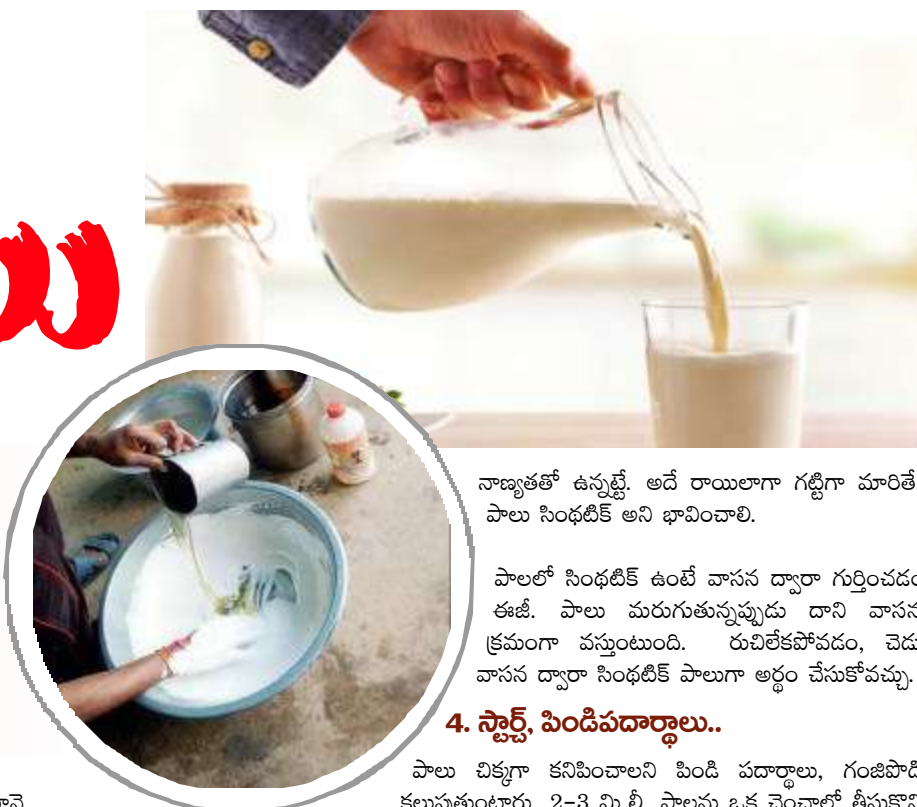
నాణ్యతతో ఉన్నట్లే అదే రాయిలాగా గట్టిగా మారితే, పాలు సింథటిక్ అని భావించాలి.

పాలలో సింథటిక్ ఉంటే వాసన ద్వారా గుర్తించడం ఈజీ. పాలు మరుగుతున్నప్పుడు దాని వాసన క్రమంగా వస్తుంటుంది. రుచిలేకపోవడం, చెడు వాసన ద్వారా సింథటిక్ పాలుగా అర్థం చేసుకోవచ్చు.