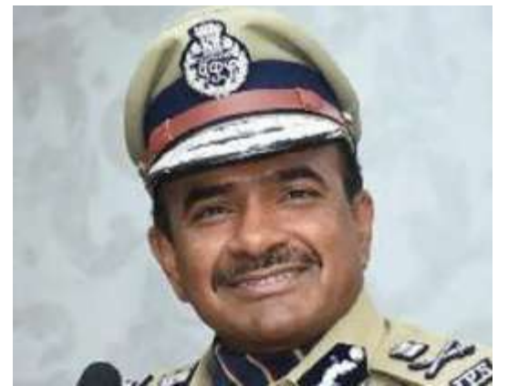
పోలీసు అధికారుల బదిలీపై సోషల్ మీడియాలో పోస్ట్