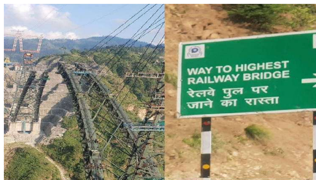
ఏప్రిల్ చివరికి లేదంటే మే నెల మొదట్లో పూర్తవుతాయని ఓ అధికారి తెలిపారు.

మన దేశ నిర్మాణ రంగంలో మరో అద్భుతం వచ్చి చేరనుంది. జమ్మూ అండ్ కశ్మీర్ ప్రాంతంలోని కాట్రా, బనిహాల్ మధ్య 111 కిలోమీటర్ల మార్గంలో ఈ ప్రాజెక్టు నిర్మితమవుతోంది. పనులు తుది దశకు చేరుకున్నాయి. చీనాబ్ నదిపై నిర్మిస్తున్న ఈ ప్రాజెక్టుకు చాలా విశిష్టతలు ఉన్నాయి. గంటకు 213 మైళ్ల వేగంతో వీచే గాలులను నిరోధించి తట్టుకోగల సామర్థ్యంతో దీన్ని నిర్మించారు. ఈ తీగల రైలు వంతెనపై 100 కిలోమీటర్ల వేగంతో రైళ్లు ప్రయాణించవచ్చు. గాలుల వేగం 90 కిలోమీటర్ల దాటిన సందర్భాల్లో రైళ్లను నిలిపివేస్తారు. కేబుల్ ఆధారిత వంతెన మధ్య భాగం నది ఉపరితలం నుంచి 331 మీటర్ల ఎత్తులో ఉంటుంది. ఈ వంతెన నిర్మాణం పూర్తయితే కశ్మీర్ వ్యాపి మొత్తం రైల్వే నెట్ వర్క్ లో అనుసంధానం అవుతుంది. వంతెన పొడవు 72.5 మీటర్లు. 2003లో అనుమతులు రాగా, 2004లో నిర్మాణం ప్రారంభమైంది. మొత్తానికి దీని నిర్మాణాన్ని ముగింపుదశకు తీసుకోవచ్చు. ప్రపంచంలోనే ఎత్తయిన రైల్వే బ్రిడ్జి ఇదేనట. ప్యారిస్ లోని ఈఫిల్ టవర్ కంటే ఈ వంతెన పొడవు 35 మీటర్లు అధికం. పర్యట ప్రాంతాల నడుమ ఎత్తయిన ప్రదేశంలో ఇది ఉంది. పనులు తుది దశకు చేరుకోగా, మరో రెండు నెలల్లో ప్రారంభం కానుంది. 47 సెగ్మెంట్లకుగాను 41 పూర్తియినట్లు, మిగిలినవి