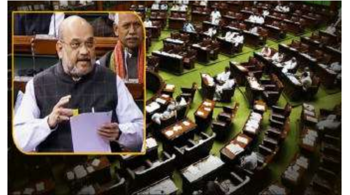
వాయిదా పడ్డాయి. వివక్షల నిరసనలతో సోమవారం లోక్సభ, రాజ్యసభ కార్యక్రలాపాలు నేటికి వాయిదా పడ్డాయి. వరాకాల సమావేశాల మూడో రోజు పార్లమెంటు మణిపూర్ పరిస్థితిపై 6లో

న్యూఢిల్లీ (ప్రశ్న స్వూస్) మణిపూర్ ఘటనలపై పార్లమెంట్ ఉభయసభలు అట్టుడికాయి. ఉదయం సమావేశమైనప్పటి నుంచి ఉభయసభల్లోనూ వివక్షలు మణిపూర్ ఘటనలపై ప్రధాని మోడీ స్పందన కోరుతూ కార్యక్రలాపాల్ని అడ్డుకున్నాయి. కేంద్రం తరఫున మంత్రులు పదే పదే విజ్ఞప్తి చేసినా, స్పీకర్, రాజ్యసభ చైర్మన్, వైస్ చైర్మన్ సభ్యులపై ప్రయత్నించినా వివక్షలు శాంతించలేదు. అసలే ఇండియా పేరుతో కొత్త కూటమి ఏర్పాటు చేసుకుని ఏకమైన వివక్షలు ఉమ్మడి నిరసనలు కొనసాగించాయి. దీంతో ఉభయసభలు పదే పదే