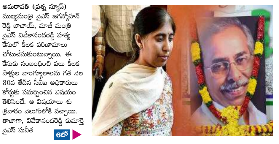
అమరావతి (ప్రశ్న స్వాస్) ముఖ్యమంత్రి వైఎస్ జగన్మోహన్ రెడ్డి బాబాయ్, మాజీ మంత్రి వైఎస్ వివేకానందరెడ్డి హత్య కేసులో కీలక పరిణామాలు చోటుచేసుకుంటున్నాయి. ఈ కేసుకు సంబంధించి పలు కీలక సాక్షుల వాంగ్మూలాలను గత నెల 30వ తేదీన సీబీఐ అధికారులు కోర్టుకు సమర్పించిన విషయం తెలిసింది. ఆ విషయాలు శుక్రవారం వెలుగులోకి వచ్చాయి. తాజాగా, వివేకానందరెడ్డి కుమార్తె వైఎస్ సునీత