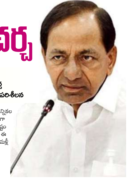
జరిగిన రెండు దఫాలు ఎన్నికల పరిస్థితి మాత్రం కచ్చితంగా ఉండదనే సంకేతాలు స్పష్టం కనిపిస్తున్నాయి. అయితే ఈ క్రమంలోనే సిట్టింగులతో మళ్లీ డిటెక్టు ఇస్తామంటూ గులాబీ బాస్ ప్రకటించటం కూడా

హైదరాబాద్ (ప్రశ్న స్వాస్) తెలంగాణలో ఎన్నికలు సమీపిస్తున్న కొద్ది రాజకీయాలు ఆసక్తికరంగా మారుతున్నాయి. అందులోనూ అధికార పార్టీ బీఆర్ఎస్ లో సమీకరణాలు పూర్తిగా మారిపోతున్నాయి. ఈసారి రాష్ట్రంలో బీఆర్ఎస్ కు గడ్డిపోటీనే ఎదురయ్యే అవకాశాలు కనిపిస్తున్నాయి. గతంలో