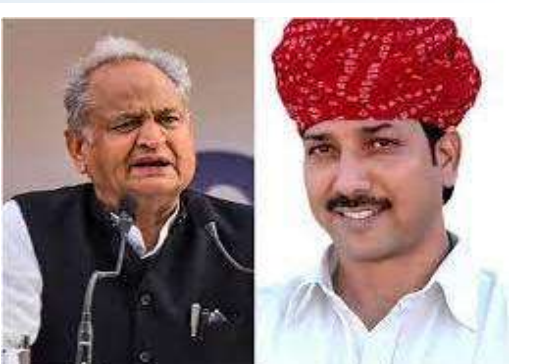
రాజస్థాన్ లోనే ముఖ్యమంత్రిగా రక్షణ లేదని అలాంటి వారు ముణిషూర్ గురించి మాట్లాడుతున్నారని

జైపూర్ (ప్రశ్న స్వాస్) ఈ ఏడాది చివర్లో ఎన్నికలు జరగనున్న వేళ రాజస్థాన్ లో రోజురోజుకూ రాజకీయం రసవత్తరంగా సాగుతోంది. ఇప్పటికే సొంత పార్టీలో సబిన్ సైలెట్ వర్గంతో అంతర్గత పోరు ఎదుర్కొంటున్న సీఎం అశోక్ గెహ్లాట్ తాజాగా ఓ మంత్రిని పదవి నుంచి తొలగించారు. ముణిషూర్ ఘటనపై రాజస్థాన్ అసెంబ్లీలో కాంగ్రెస్ నేతలు నిరసనలు తెలిపారు. అదే సమయంలో కలగజేసుకున్న మంత్రి రాజేంద్ర గుధా