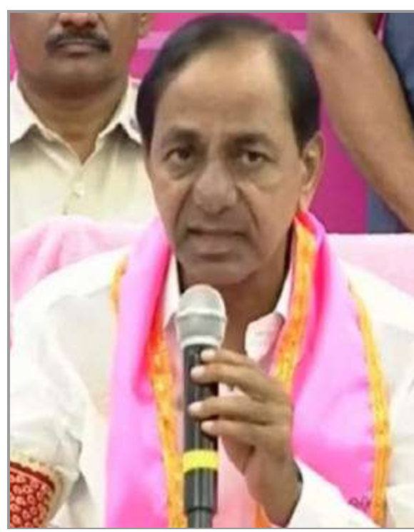
పార్టీని ప్రజల్లోకి తీసుకెళ్లే వ్యూహంలో భాగంగానే కేసీఆర్ పోటీ గతంలోనూ ఇదే వ్యూహం

ఇక 2019 ఎన్నికల్లో కాంగ్రెస్ అగ్రనేత రాహుల్ గాంధీ కేరళలోని వయనాడ్ నుంచి ఎంపీగా గెలిచారు. గతంలో ఇందిరాగాంధీ తన సొంత నియోజకవర్గమైన రాయబరేలిని వదులుకుని మెడక్ నుంచి ఎంపీగా విజయం సాధించారు. గతంలో చాలామంది నేతలు తమ సొంత రాష్ట్రం నుంచి కాకుండా వేరే రాష్ట్రాల నుంచి లోక్ సభకు ఎన్నికయ్యారు. తమ పార్టీని వేరే రాష్ట్రాల్లో కూడా బలోపేతం చేయడం, శ్రేణుల్లో ఉత్సాహం నింపేందుకు ఇలా నేతలు వేరే రాష్ట్రాల నుంచి పోటీ చేశారు. ఇప్పుడు కేసీఆర్ కూడా అదే పూర్వోన్మి అమలు చేయాలని చూస్తున్నారని తెలుస్తోంది. అందుకే మహారాష్ట్ర నుంచి ఎంపీగా బరిలోకి దిగాలని సమాలోచనలు జరుపుతున్నట్లు ప్రచారం సాగుతోంది.