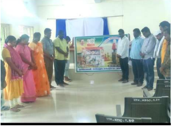
వెంకటాపురం ( ప్రశ్న స్వూస్) ములుగు జిల్లా వెంకటాపురం మండలం తెలంగాణ రాష్ట్ర అవతరణ దశాబ్ది ఉత్సవాల్లో భాగంగా గురువారం నాడు తెలంగాణ అమరవీరుల సంస్మరణ దినోత్సవాన్ని పురస్కరించుకుని మండలం లోని వెంకటాపురం,మరికాలా ఉప్పెడువీరాపురం పలు పంచాయతీల్లో అమరుల త్యాగాలకు గురైనా మౌనం పాటింది వారికి ఘనంగా నివాళు అర్పించి,అమరుల సంస్మరణ తీర్మానం చేయడం జరిగింది.అనంతరం నాయకులు మాట్లాడుతూ రాష్ట్ర సాధన కోసం సాగిన పోరులో అనువులు బాసిన అమరులకు ప్రతి సంవత్సరంలోనూ