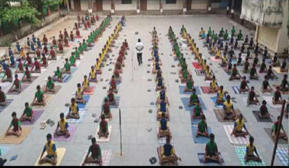
ములుగు (ప్రశ్న స్వాస్):