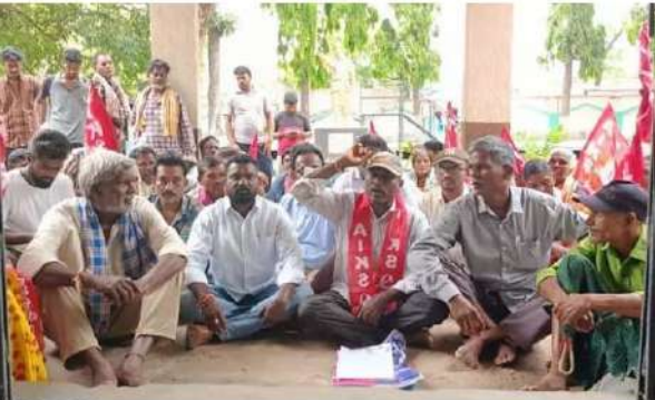
ఏటూరు నాగారం