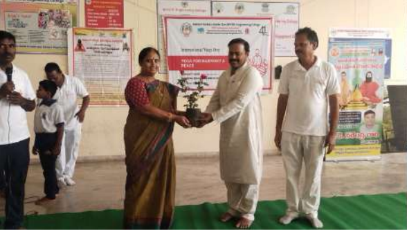
హైదరాబాద్