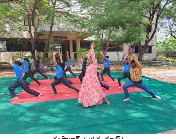
శంషాబాద్ (ప్రశ్న స్వాస్)